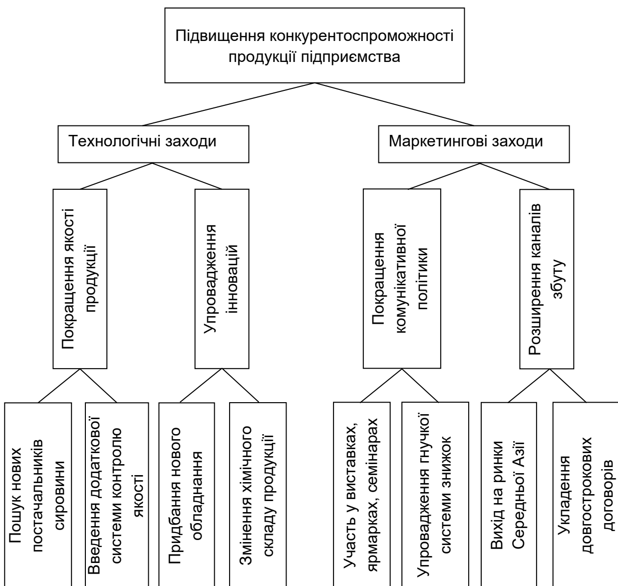
Рис. М.1. Дерево цілей щодо підвищення конкурентоспроможності продукції

Дерево цілей, спрямоване на підвищення конкурентоспроможності продукції, подане на рис. М.1.